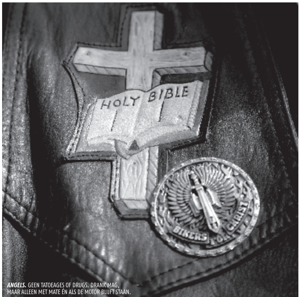
ANGELS. GEEN TATOEAGES OF DRUGS. DRANK MAG, MAAR ALLEEN MET MATE EN ALS DE MOTOR BLIJFT STAAN.