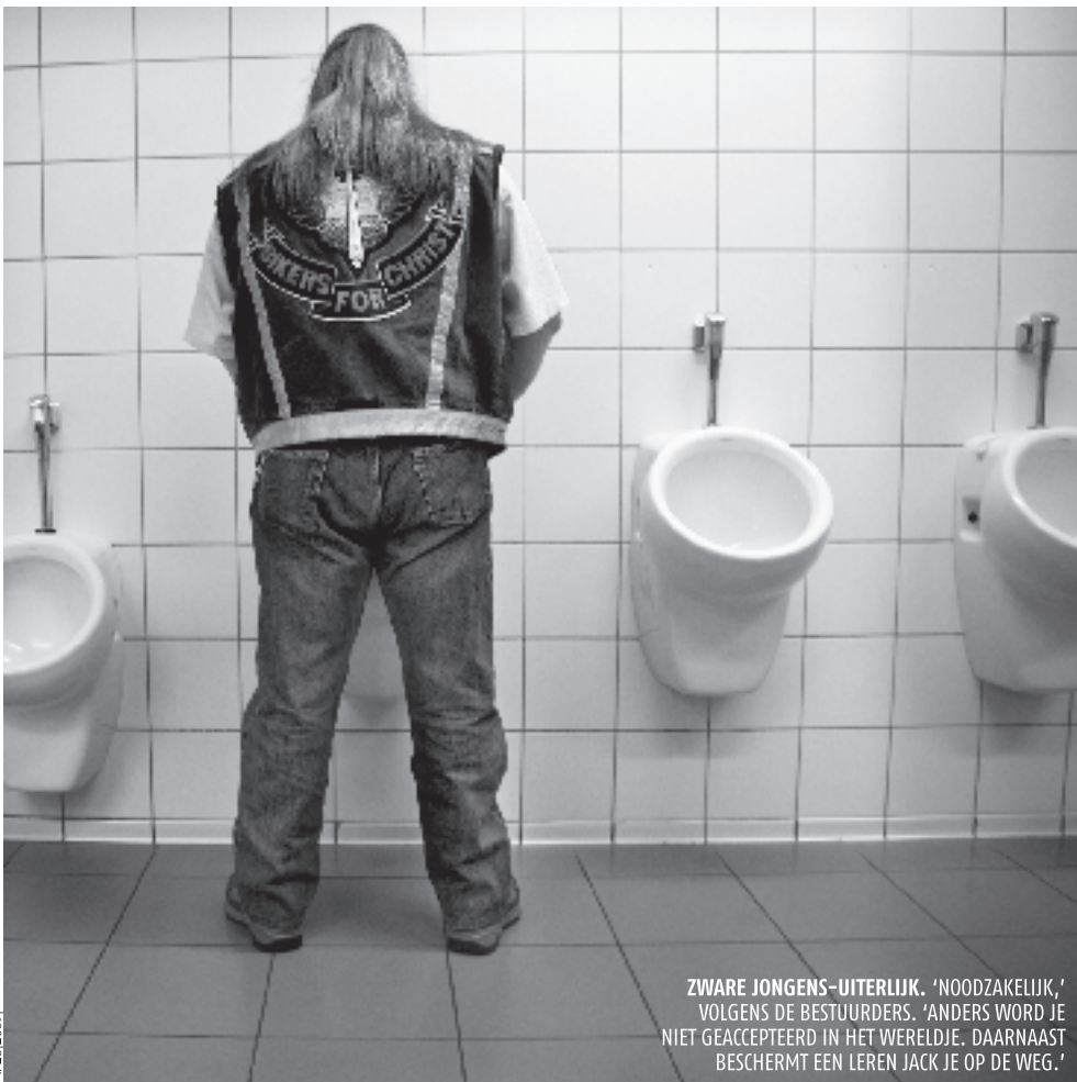
ZWARE JONGENS-UITERLIJK. 'NOODZAKELIJK,' VOLGENS DE BESTUURDERS. 'ANDERS WORD JE NIET GEACCEPTEERD IN HET WERELDJE. DAARNAAST BESCHERMT EEN LEREN JACK JE OP DE WEG.'