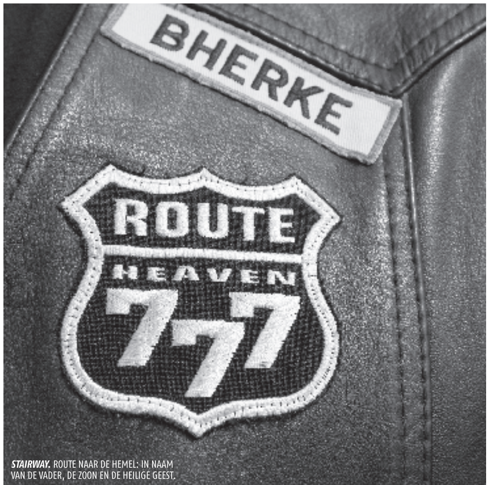
STAIRWAY. ROUTE NAAR DE HEMEL: IN NAAM VAN DE VADER, DE ZOON EN DE HEILIGE GEEST.